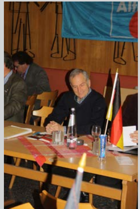
Heute ist Martin Hohmann, dessen Rede immer wieder als antisemitisch bezeichnet wurde, Bundestagsabgeordneter für die AfD.

Rechte Einstellungen beim KSK ziehen sich bis in die Führungsebene durch. Der ehemalige KSK-Kommandeur Reinhard Günzel wurde 2003 entlassen, weil er eine antisemitische Rede 5 des damaligen CDU-Abgeordneten Hohmann lobte. Günzel steht der rechtspopulistischen Partei Pro NRW nahe. 6 Nach seiner Entlassung trat er mehrfach in rechten Krei-