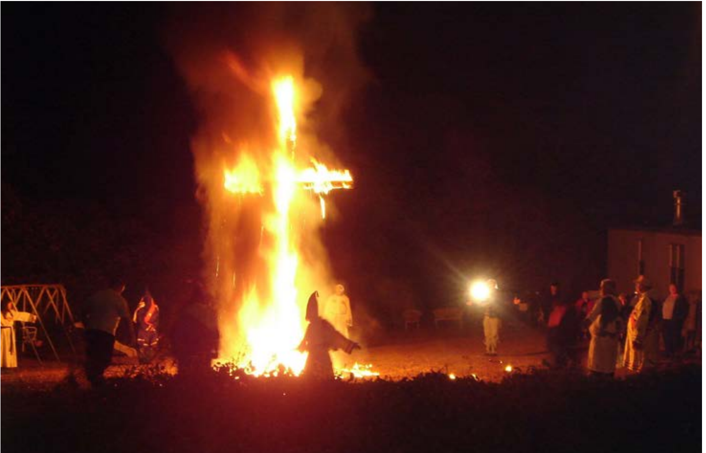
Kreuzverbrennung durch den rassistischen Ku-Klux-Klan (Symbolbild). Auch zwei Polizisten der BFE 523 waren Ku-Klux-Klan-Mitglieder. Gestört hatte sich daran offenbar für lange Zeit niemand.

UNITER hat aber noch Pläne, die weit darüber hinaus gehen: Der Verein plant, selbst Sicherheitskräfte anderer Staaten, aber womöglich auch anderer Sicherheitsfirmen, auszubilden. Dies kann unter Umständen auch Diktaturen betreffen. So traf sich am 13.2.2019 ein Vertreter von UNITER mit Politiker*innen und hochrangigen Polizist*innen auf den Philippinen. Der philippinische Präsident Rodrigo Duterte bezeichnet sich selbst als Diktator und Menschen, die im Verdacht stehen Drogen zu konsumieren oder zu handeln, werden dort ohne Prozess erschossen. Es gibt also sehr gute Gründe, Sicherheitskräfte dieses Staates nicht auszubilden. UNITER plant jedoch, genau dies zu tun: In einem zwei- bis viertägigen Training, das von UNITER angeboten wird, sollen die Teilnehmenden lernen, auf Extremsituationen reagieren zu können. Offenbar sind dabei auch Trainings mit Waffen vorgesehen. Vorkenntnisse in diesem Bereich seien jedoch nicht notwendig, so UNITER. Es ist zu befürchten, dass sich UNITER nicht nur als Ausbildungsplattform für rechte Prepper, sondern auch für andere Staaten entwickelt: eine international agierende Truppe von Söldner*innen – wenn man so will: eine Art deutsches Blackwater. Denn UNITER bietet seine Dienste nicht nur den Philippinen an, sondern auch anderen Staaten oder Firmen im Ausland, z.B. in Russland, im Iran, in Guinea oder in Libyen. 55