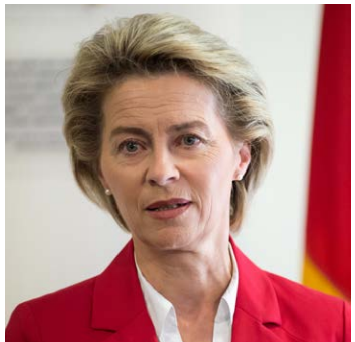
Das Verteidigungsministerium hat angeblich keine Erkenntnisse über ein rechtes Netzwerk in der Bundeswehr. Das Problem wird geleugnet. Quelle: Wikipedia

1. Die erste ist naheliegend und simpel. Diese Variante ist zugleich die wahrscheinlichste: Rechtsextremist*innen im Staatsapparat gab es schon immer. Dies wird nicht zuletzt durch die autoritären, konservativen Strukturen der Polizei, der Geheimdienste und der Bundeswehr sowie personelle Kontinuitäten nach dem Nationalsozialismus noch zusätzlich begünstigt. Solange Rechtsextremist*innen im Staatsapparat sich nicht gegen den Staat wandten oder in die öffentliche Kritik gerieten,