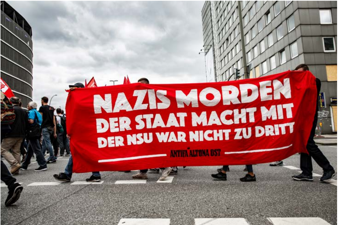
Antifaschist*innen fragen sich: Welche Rolle spielt der Staat innerhalb rechtsterroristischer Netzwerke?