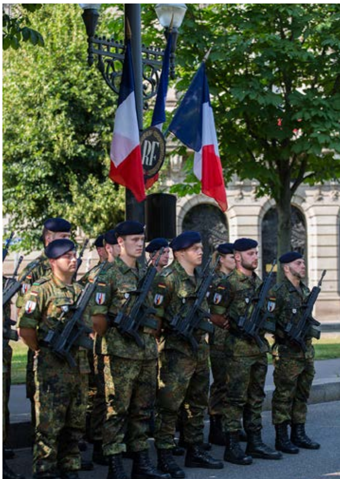
Abordnung des Jägerbataillons 291 in Straßburg (2013).

Als Albrecht am 3. Februar 2017 am Wiener Flughafen mit einer Waffe aufgegriffen wurde, brachte er letztendlich das rechte Netzwerk um UNITER auf den Radar der Behörden. Nachdem Albrecht in Wien den Ball der Offiziere besucht hatte, fand er – so seine Darstellung – am 21. Januar 2017 abends zufällig eine