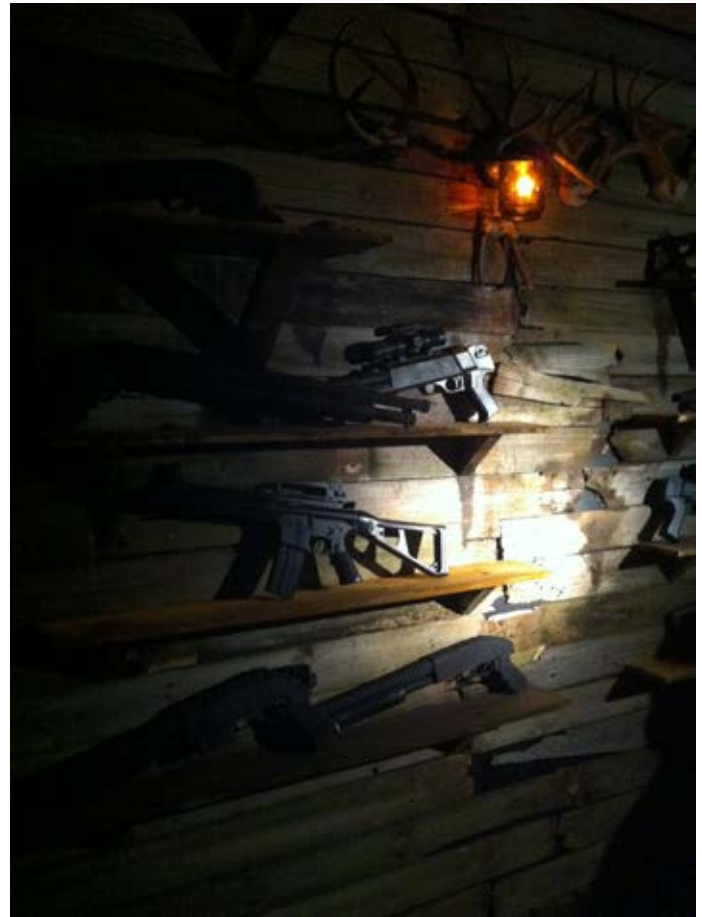
Bei mehreren Mitgliedern der Chatgruppe Nordkreuz wurden Waffen gefunden. Symbolbild.

Am 28. August 2017 kam es in Mecklenburg-Vorpommern